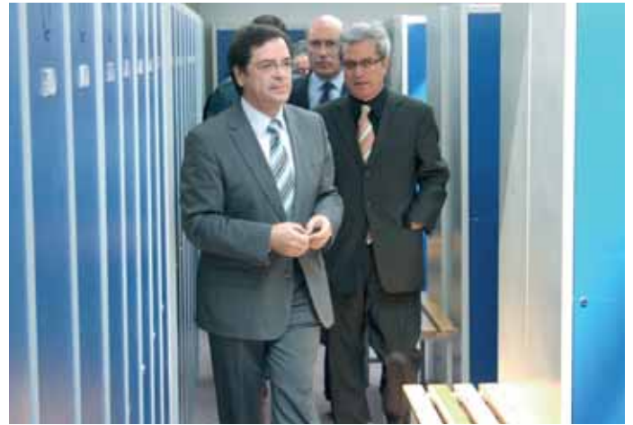
El delegado y el conseller d'Interior visitan las dependencias.