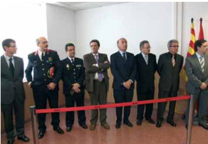
Representantes de cuerpos policiales presentes en el acto.