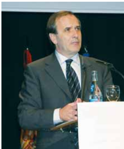
José Antoni Alonso, ministro de Defensa.

Durante su visita al Centro Geográfico del Ejército, Alonso aseguró que no le 'consta' que los