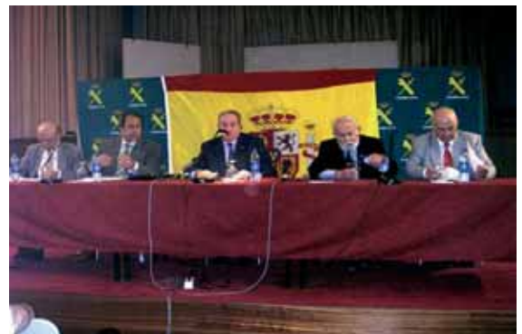
Mesa presidencial de la asamblea general celebrada el pasado mes de mayo.